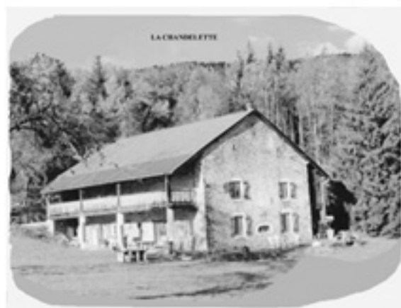
Campagne contre l'Allemagne : Du 9 avril 1915 au 24 décembre 1918.