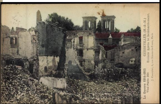
La Guerre 1914-1918 Ruines Après le bombardement.