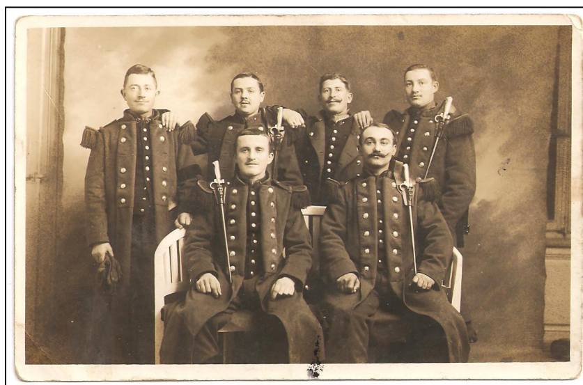
Assis : 1 er à gauche