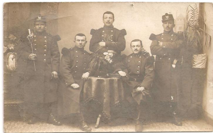
Assis : à droite