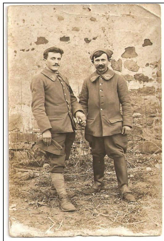
Debout à gauche