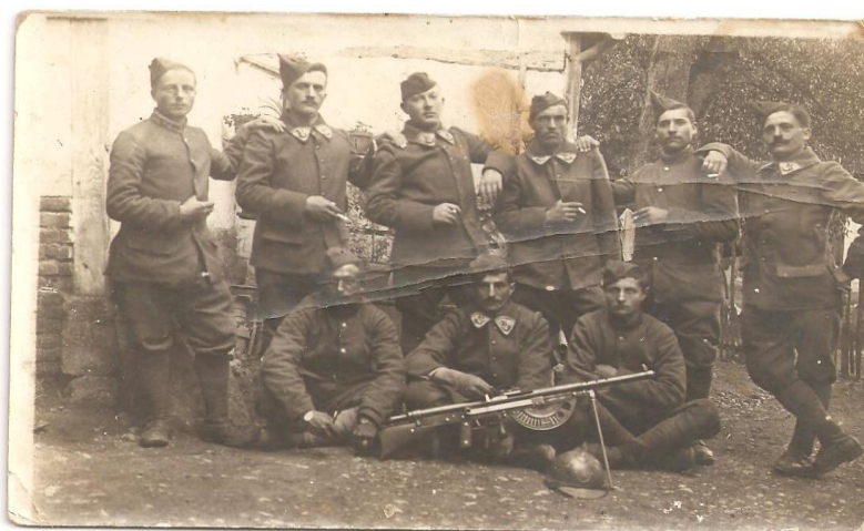
En haut : 2 er à gauche